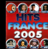
Hit France 2005 Compilation (Sony/BMG)