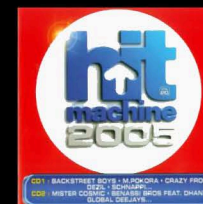
Hit Machine 2005 Volume 20 (Sony/BMG)