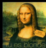
CD 2 titres « Tu es Blonde » (Warner/2005)